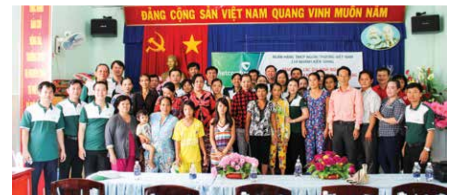
Đại diện BGD, BCH Công đoàn, Đoàn thanh niên Vietcombank Kiên Giang chụp ảnh lưu niệm với lãnh đạo địa phương và đại diện các gia đình nghèo thuộc xã đảo Lại Sơn, huyện Kiên Hải, tỉnh Kiên Giang

Với tinh thần “Tương thân, tương ái”, nhằm góp một phần hỗ trợ các gia đình nghèo có điều kiện đón Tết Bính Thân 2016 đầy đủ, đầm ấm hơn, ngày 29/1/2016, Đại diện Ban giám đốc, BCH Công đoàn, Đoàn thanh niên Vietcombank Kiên Giang tổ chức đi thăm, hỏi và tặng 150 phần quà với tổng số tiền 45.000.000 đồng cho các gia đình nghèo thuộc xã đảo Lại Sơn, huyện Kiên Hải, tỉnh Kiên Giang. Đây là hoạt động xã hội thường niên được Vietcombank Kiên Giang đưa vào chương trình hoạt động an sinh xã hội hàng năm cùng chung tay góp sức trong mỗi dịp Tết đến, Xuân về. □