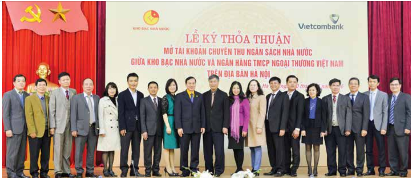
Các đại biểu chụp ảnh lưu niệm