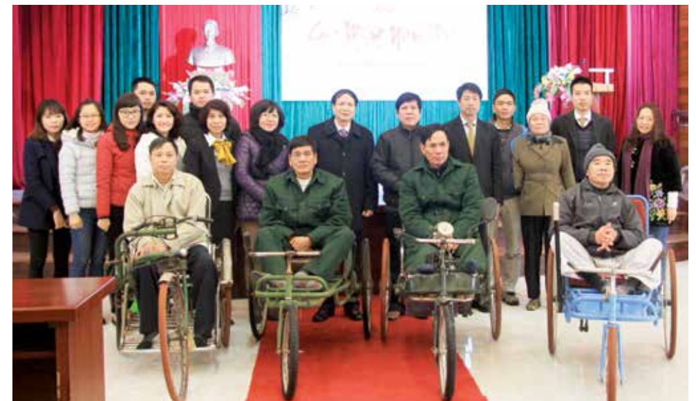
Công đoàn Vietcombank Bắc Ninh và Vietcombank Hoàn Kiếm thăm và tặng quà Trung tâm điều dưỡng thương binh Thuận Thành