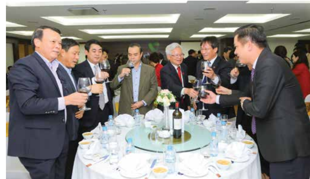
Các đại biểu, khách quý nâng ly chúc mừng thành công của Vietcombank Thăng Long