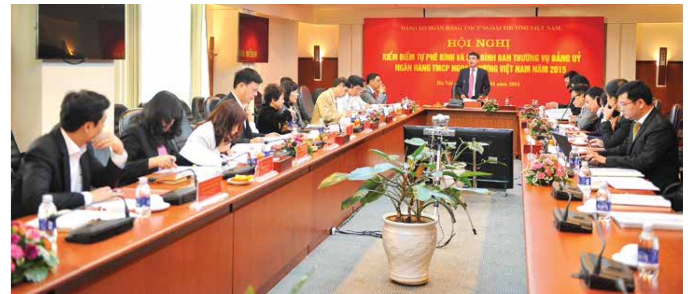
Toàn cảnh Hội nghị

Sau 01 ngày làm việc khẩn trương, trên tinh thần thẳng thắn nghiêm túc, Hội nghị đã kết thúc, thành công tốt đẹp. Ban Thường vụ Đảng ủy Vietcombank quyết tâm phát huy những ưu điểm, thành tích đạt được trong năm 2015 và khắc phục những tồn tại, hạn chế để lãnh đạo Đảng bộ Vietcombank đạt được kết quả, thành tích tốt hơn trong năm 2016 và những năm tiếp theo. □