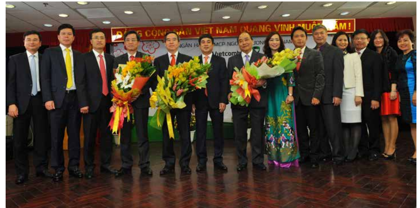
Ban lãnh đạo Vietcombank tặng hoa cảm ơn đ/c Nguyễn Xuân Phúc - Ủy viên Bộ Chính trị, Phó Thủ tướng Chính phủ cùng đ/c Nguyễn Văn Bình - Ủy viên Bộ Chính trị, Thống đốc NHNN VN và đ/c Nguyễn Quang Dương - Ủy viên BCH TW Đảng, Phó Bí thư Đảng ủy Khối Doanh nghiệp TW