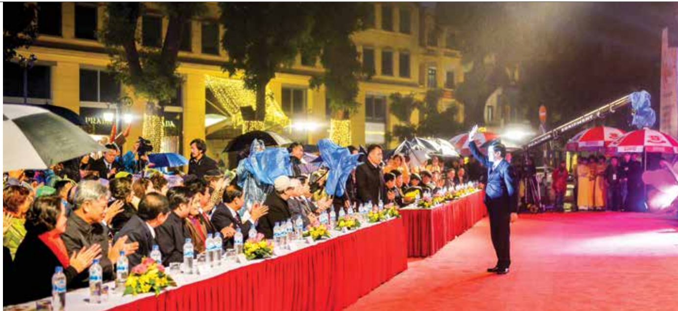
Chủ tịch nước Trương Tấn Sang vui mừng chào đón đồng bào và con kiều bào và các đại biểu tham dự chương trình “Xuân quê hương 2016”