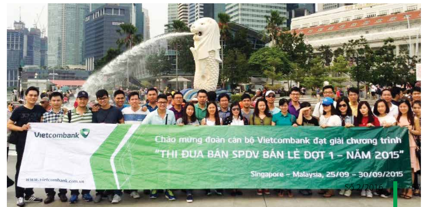
Đoàn khảo sát tại Singapore – Malaysia đợt 1 – tháng 09/2015

Mang lại cơ hội học tập, trao đổi kinh nghiệm quý báu tại những vùng đất mới là trải nghiệm thú vị để tận hưởng những thành quả đạt được trong suốt những tháng nghỉ cho các cá nhân đạt giải, chương trình thi đua đã được đón nhận nồng nhiệt và sẽ cố gắng làm tốt hơn nữa bốn phần đó để gửi “món quà tinh thần” cho các chiến binh dũng cảm trên mặt trận Bán lẻ, bồi đắp thêm tình cảm gắn bó giữa các chi nhánh trong hệ thống Vietcombank. Hy vọng chương trình sẽ giúp sức thêm cho chúng ta trên con đường âm thầm, vất vả nhưng không kém phần vinh quang này – con đường lựa chọn với ngân hàng bán lẻ. □