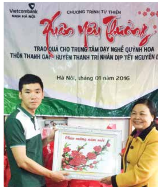
Đại diện Trung tâm dạy nghề từ thiện Quỳnh Hoa tặng quà lưu niệm (sản phẩm của Trung Tâm) thay lời cảm ơn đến Vietcombank Nam Hà Nội