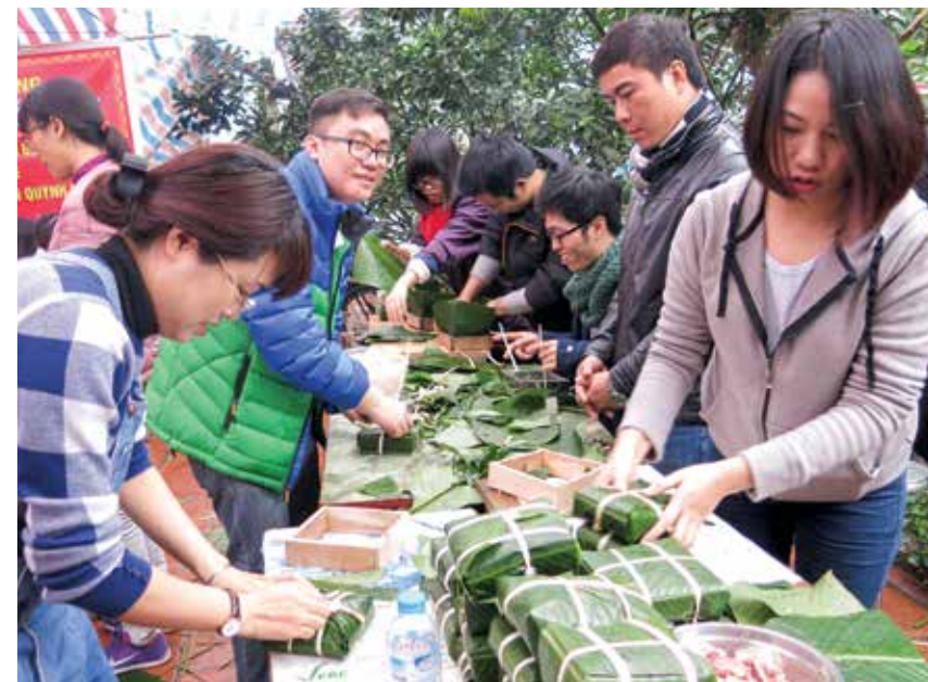
Các CBNV Vietcombank Nam Hà Nội tham gia gói bánh chưng

Hoạt động thiện nguyện của Vietcombank Nam Hà Nội đã góp phần mang lại một cái Tết đầm ấm, yên vui cho các gia đình khó khăn, giúp đỡ những người khuyết tật hòa nhập với cộng đồng, nối tiếp truyền thống tốt đẹp “Lá lành đùm lá rách” của dân tộc. □