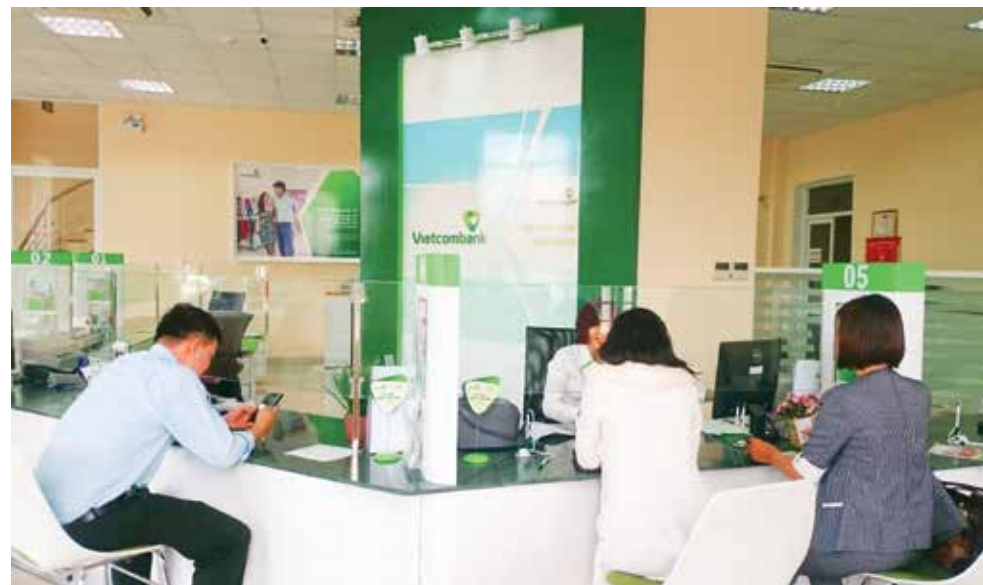
Quang cảnh giao dịch

nhân viên, đến tủ bàn lưu trữ hồ sơ, hệ thống kho tiền, hệ thống phòng cháy chữa cháy, hệ thống camera giám sát... đầy đủ, phục vụ tốt cho nhu cầu công việc hằng ngày, đảm bảo đáp ứng yêu cầu của khách hàng, thể hiện một phong cách chuyên nghiệp. Sau nhiều năm hoạt động trong điều kiện cơ sở