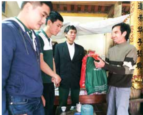
Công đoàn Vietcombank Nam Hà Nội trao tặng quà Tết cho các gia đình có hoàn cảnh khó khăn

Ngày 30/1/2016, đại diện Ban chấp hành CĐCS, Đoàn viên thanh niên đã tham gia gói, luộc bánh chưng cùng các thành viên của