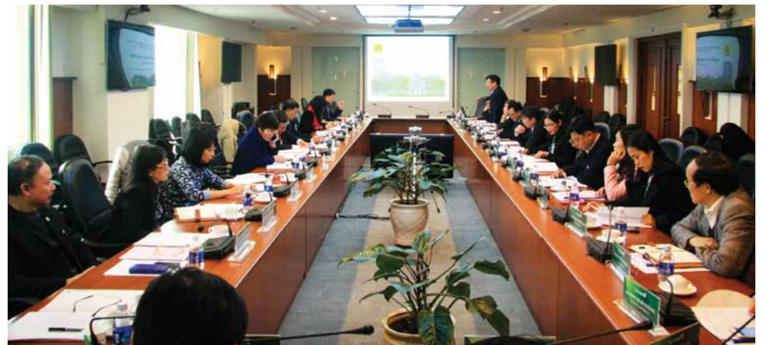
Toàn cảnh Hội nghị BCH Công đoàn Vietcombank lần thứ 8 – nhiệm kỳ IV