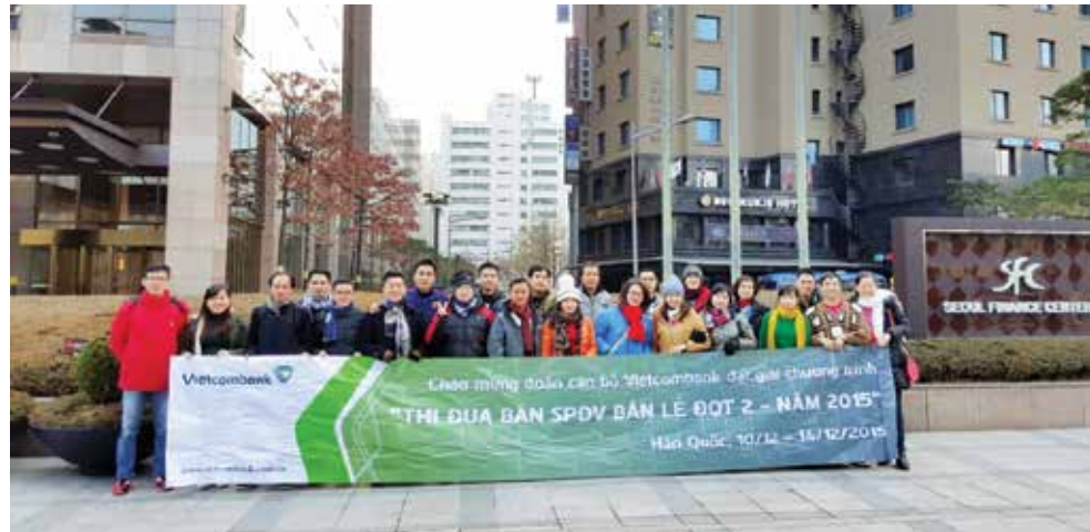
Đoàn khảo sát tại Hàn Quốc đợt 2 – tháng 12.2015