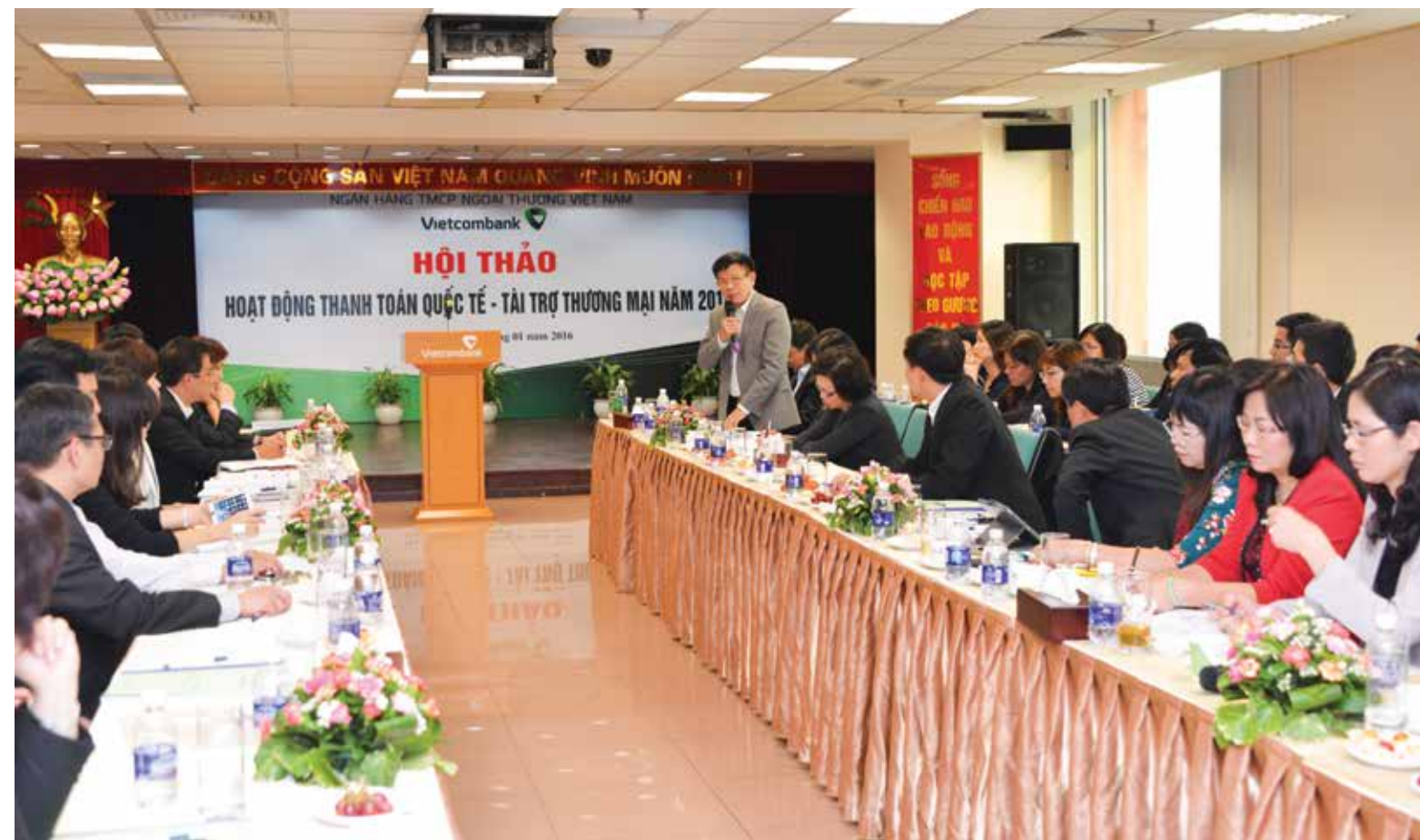
Các thành viên Ban lãnh đạo phát biểu tại Hội thảo

Sau 1 ngày làm việc khẩn trương và nghiêm túc, Hội thảo TTQT và TTTM của Vietcombank năm 2016 đã thành công tốt đẹp với sự tham gia, chỉ đạo, định hướng sát sao của Ban lãnh đạo, tinh thần tham gia thảo luận sôi nổi cùng nhiều ý kiến đóng góp, chia sẻ thiết thực và ý nghĩa từ những người làm công tác trực tiếp tại các chi nhánh với tinh thần huy động trí tuệ tập thể, cùng thống nhất kế hoạch hành động cho mảng TTQT-TTTM của Vietcombank. Từ đó có thể tin tưởng rằng năm 2016 công tác TTQT-TTTM của Vietcombank sẽ đạt được nhiều thành công. □