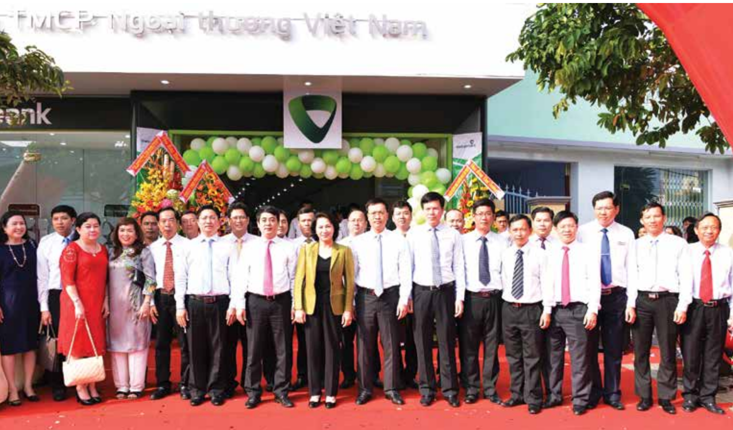
Ủy viên Bộ Chính trị, Phó Chủ tịch Quốc hội nước Cộng hòa XHCN Việt Nam Nguyễn Thị Kim Ngân chụp hình lưu niệm với các đại biểu tại buổi lễ