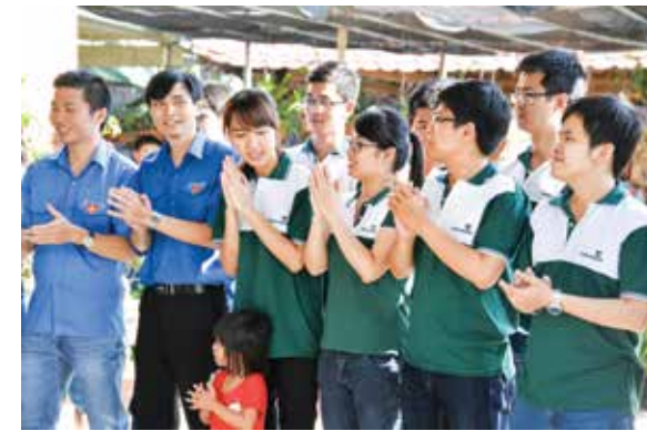
Đoàn viên thanh niên Vietcombank Khánh Hòa cùng Chi cục Thuế tỉnh Khánh Hòa hát giao lưu cùng các em nhỏ tại chùa Phật Bửu

Thanh niên chúng tôi lại tiếp tục tới thăm Mẹ liệt sỹ. Căn nhà nhỏ nằm lọt thỏm gọn lỏn cuối ngõ. Căn nhà bé xíu tưởng chừng như không chứa nổi hết những bạn trẻ chúng tôi. Mẹ nằm ngủ ngon giấc. Cháu dâu Mẹ lặng lẽ ngồi nhìn chúng tôi