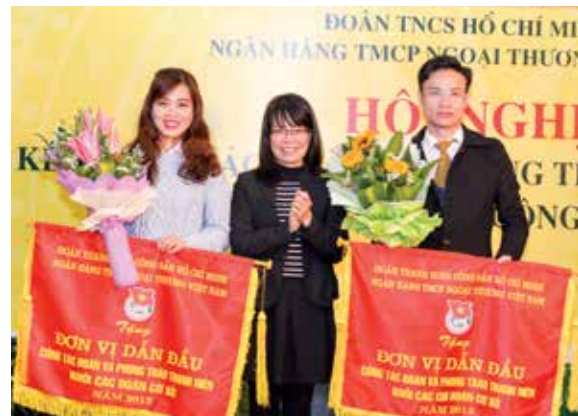
Các đơn vị nhận cờ thi đua của Đoàn Vietcombank đã có thành tích dẫn đầu trong công tác đoàn và phong trào thanh niên Vietcombank năm 2015.