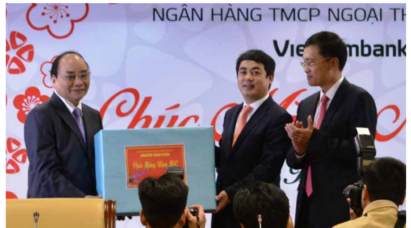
Đ/c Nguyễn Xuân Phúc - Ủy viên Bộ Chính trị, Phó Thủ tướng Chính phủ (ngoài cùng bên trái) tặng quà lưu niệm cho Vietcombank