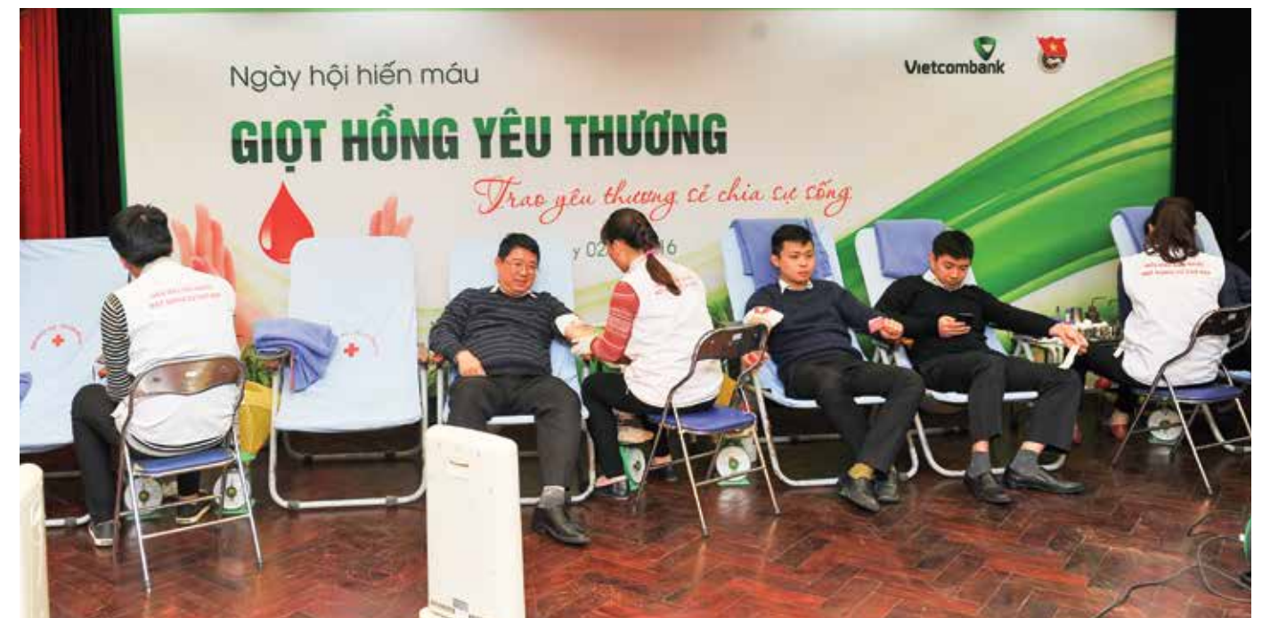
Cán bộ Trụ sở chính Vietcombank tham gia Ngày hội hiến máu nhân đạo “Giọt hồng yêu thương” năm 2016