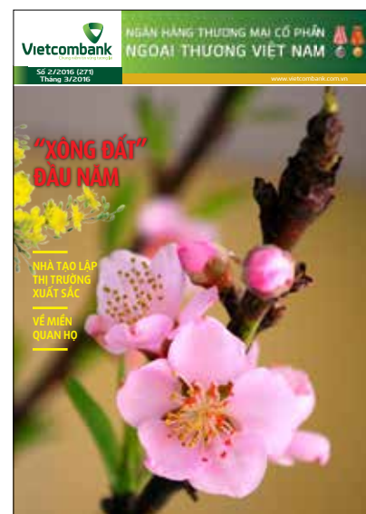
BẢN TIN CỦA NGÂN HÀNG TMCP NGOẠI THƯƠNG VIỆT NAM SỐ 2/2016 (271), Tháng 3/2016