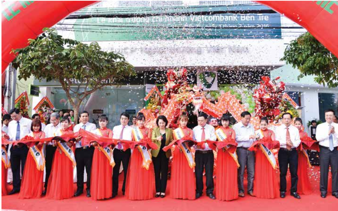
Ủy viên Bộ Chính trị, Phó Chủ tịch Quốc hội nước Cộng hòa XHCN Việt Nam Nguyễn Thị Kim Ngân cùng lãnh đạo Tỉnh ủy, UBND, NHNN tỉnh Bến Tre và Vietcombank tham dự buổi Lễ và cắt băng khai trương Chi nhánh Vietcombank Bến Tre