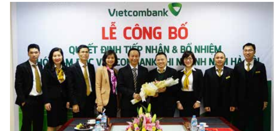
Ban giám đốc và lãnh đạo các phòng Vietcombank Nam Hà Nội chúc mừng tân Phó Giám đốc