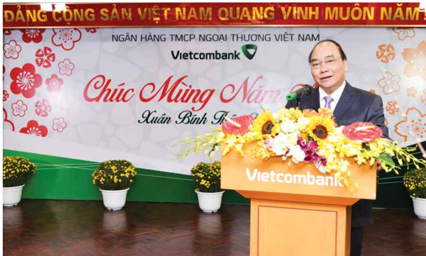
Đ/c Nguyễn Xuân Phúc - Ủy viên Bộ Chính trị, Phó Thủ tướng Chính phủ phát biểu chúc Tết tại Vietcombank nhân dịp đầu Xuân Bính Thân 2016