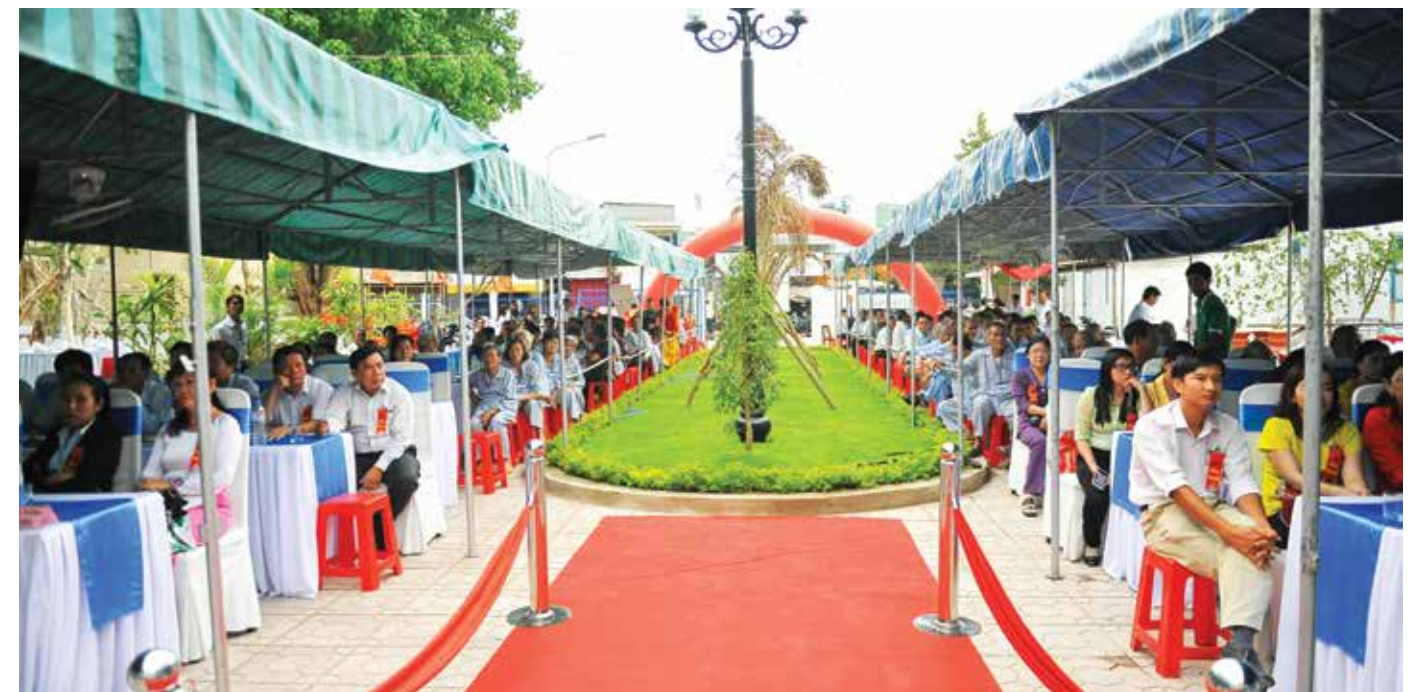
Quang cảnh và các khách mời dự Lễ khánh thành

Việc khánh thành và đưa vào sử dụng công trình vào những ngày Xuân Bính Thân đang đến rất gần càng góp phần ý nghĩa hơn, giúp các cụ già cô đơn, trẻ em mồ côi được sống trong điều kiện an toàn và tốt hơn; có được một nơi chung vui đón Tết để cảm nhận được sự ấm áp của tình người. □