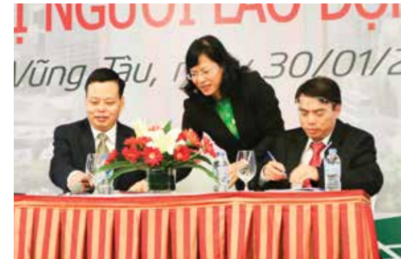
Ký kết Giao ước thi đua

Hội nghị đã thông qua Báo cáo kết quả hoạt động kinh doanh năm 2015, đồng thời triển khai nhiệm vụ hoạt động kinh doanh năm 2016. Năm bắt những thuận lợi và khó khăn từ môi trường kinh tế cả nước nói chung và trên địa bàn tỉnh Bà Rịa - Vũng Tàu nói riêng; thực hiện phương châm "Tăng tốc - Hiệu quả - Bền vững" và quan điểm chỉ đạo điều hành "Quyết liệt - Kết nối - Trách nhiệm" của Vietcombank, cùng với nỗ lực của tập thể Ban giám đốc và toàn thể người lao động, hoạt động kinh doanh năm 2015 của