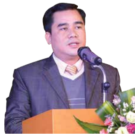
Đ/c Vũ Đức Tú - Ủy viên Ủy ban kiểm tra TW Đoàn, Phó Bí thư Đoàn khối DNTW phát biểu tại Hội nghị