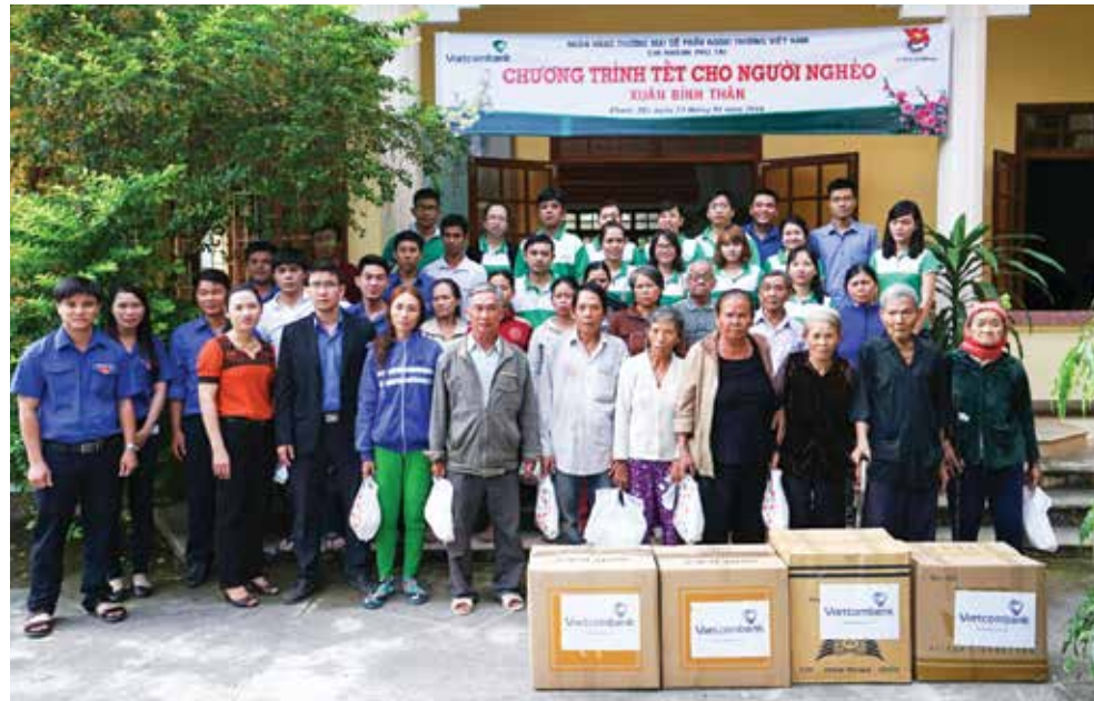
Chương trình Tết cho người nghèo tại xã Phước Mỹ - TP Quy Nhơn