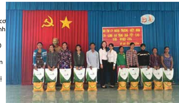
Vietcombank Long An tặng quà cho hộ nghèo tại xã Mỹ Quý Tây, Đức Huệ, Long An

Chương trình đã mang lại niềm vui cho bà con nghèo vui Xuân đón Tết. Đồng thời góp phần giáo dục thanh niên về truyền thống lá lành đùm lá rách, sống vì cộng đồng. □