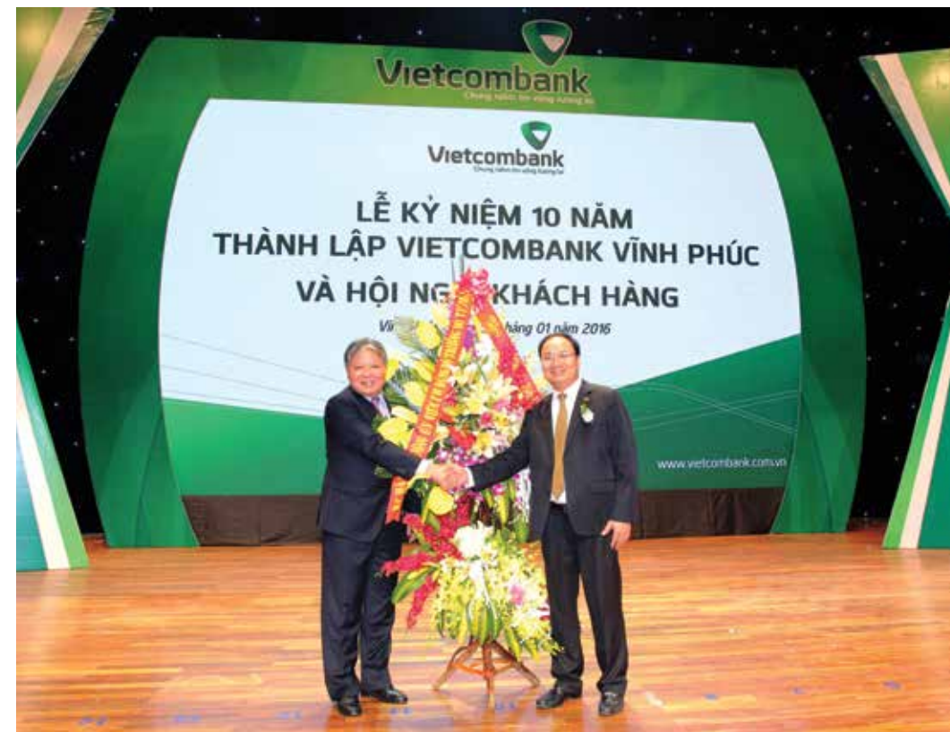
Ông Hà Hùng Cường - UVTW Đảng, Bộ trưởng Bộ Tư pháp (bên trái) trao tặng lẵng hoa chúc mừng cho Ban giám đốc Vietcombank Vĩnh Phúc