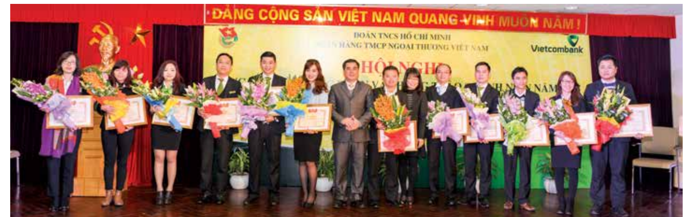
Các tập thể và cá nhân Đoàn Vietcombank nhận Bằng khen của TW Đoàn đã có thành tích trong công tác đoàn và phong trào thanh niên năm 2015

Với những thành tích nêu trên, Đoàn thanh niên Vietcombank đã vinh dự được nhận Bằng khen của Thủ tướng chính phủ; Cờ và Bằng khen của TW Đoàn; Bằng khen của TW Đoàn trao tặng cho 9 tập thể và 18 cá nhân, Bằng khen của Đoàn Khối Doanh nghiệp Trung ương trao tặng cho 20 tập thể và 30 cá nhân. Cũng tại Hội nghị, Đoàn Vietcombank đã công bố trao tặng cờ của Đoàn Vietcombank cho đơn vị dẫn đầu khối đoàn cơ sở (Đoàn cơ sở Hội sở chính) và dẫn đầu khối chi đoàn cơ sở (Chi đoàn cơ sở Vietcombank Ninh Bình). □