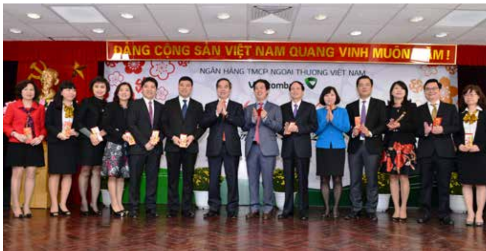
Theo phong tục truyền thống, đ/c Nguyễn Xuân Phúc - Ủy viên Bộ Chính trị, Phó Thủ tướng Chính phủ (ảnh trên, thứ 4 từ trái sang) và đ/c Nguyễn Văn Bình - Ủy viên Bộ Chính trị, Thống đốc NHNN VN (ảnh dưới, thứ 8 từ phải sang) trao tặng lì xì nhân dịp đầu Xuân

Chính trị, Phó Thủ tướng Chính phủ và đ/c Nguyễn Văn Bình - Ủy viên Bộ Chính trị, Thống đốc NHNN VN.